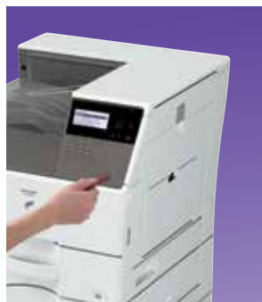
Kényelmesen elérhető USB port