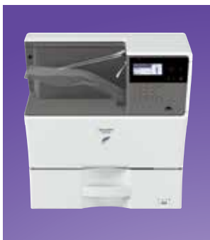
Kompakt asztali konfiguráció

A nyomtatókat számos olyan funkcióval is elláttuk, amelyek révén még több időt és pénzt takaríthat meg. Ilyen például a beépített duplex modul, amivel hatékonyan készíthet kétoldalas nyomtatásokat.