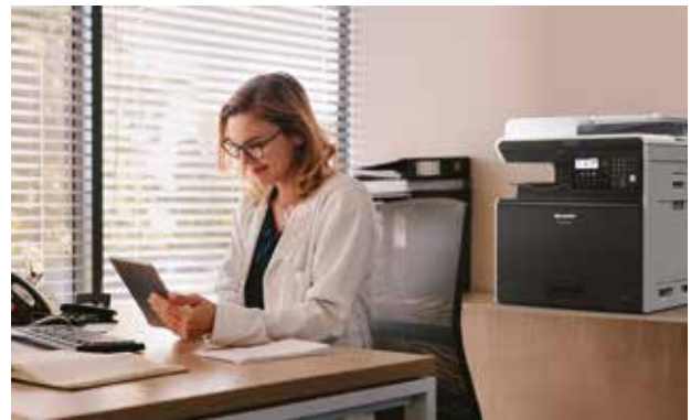
Elegáns kiegészítő bármely irodába.

Nincsenek komplex beállítások vagy összegabalyodott kábelek. Az opcionálisan elérhető vezeték nélküli LAN kiegészítő lehetővé teszi a csatlakozást bármely WiFi-kompatibilis eszközhöz, így bárki közvetlenül az okostelefonjáról, tabletjéről vagy PC-ről nyomtathat vagy szkennelhet AirPrint, Google Cloud Print vagy a Sharpdesk Mobile alkalmazás segítségével. Vagy csatlakoztasson egy USB-meghajtót és egyszerűen válassza ki a fájlt a felugró menüből, hogy közvetlenül kinyomtassa a kívánt dokumentumokat, vagy mentse el a beszkennelt anyagokat az USB eszközre számítógép használata nélkül.